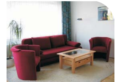
helles Wohnzimmer mit Schlafsofa