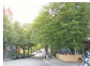
Feuerbachstraße / Ecke Schöneberger Str.

Die Schlosstraße, ca. 200 m entfernt, ist eine der beliebtesten und größten Einkaufsstraßen Berlins. Dort bestehen beste Einkaufsmöglichkeiten aller Art. Restaurants, Cafes und Kinos in der näheren Umgebung runden das Angebot ab. Aufgrund der optimalen Anbindung an den öffentlichen Nahverkehr ist die Wohnung ideal als Ausgangspunkt für die Erkundung Berlins und Umgebung geeignet.