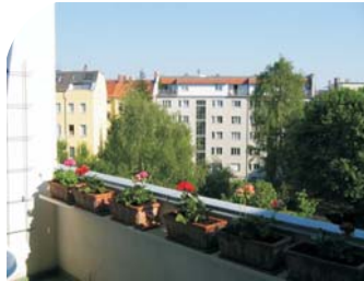
Blick vom sonnigen Balkon

Kinderreisebett/-hochstuhl, Klappbett nach Ansprache