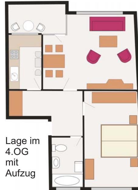
Lage im 4.OG mit Aufzug