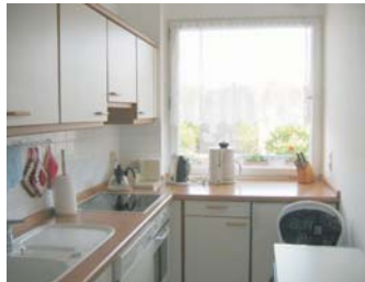
voll ausgestattete Küche