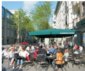
Feuerbachstraße / Ecke Schlosstraße

liegt im südwestlichen Zentrum von Berlin an der Grenze der Bezirke Schöneberg (Friedenau)/Steglitz.